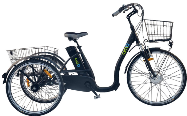
tricycle électrique CyclO2 Comfort26 noir mat, vue de profil